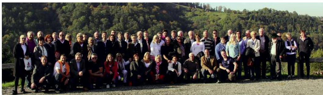
Lehrreich, informativ und unterhaltsam: Die Unternehmerreise nach Graz lieferte den rund 60 Teilnehmern wertvolle Impulse.

Nach Brüssel, Südtirol und dem Boudensee in den vergangenen Jahren, führte die Unternehmerreise das WirtschaftsForum im Herbst 2012 ins steirische Graz.