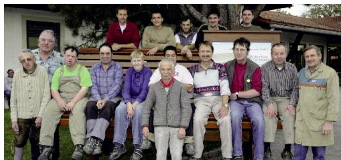
Seit 40 Jahren sind die Oberland Werkstätten ein verlässlicher Arbeitgeber für zahlreiche Menschen mit und ohne erkennbare Behinderungen.

Aus den kleinen Bastelwerkstätten der Anfangsjahre hat sich im Laufe der Zeit ein sehr erfolgreiches Unternehmen entwickelt. Die modernen Betriebe an den Standorten in Gaißbach, Polling, Geretsried und Miesbach erzielen mittlerweile einen Jahresumsatz von rund 17 Millionen Euro. Im kommenden Jahr feiert die gemeinnützige Oberland Werkstätten GmbH den 40. Geburtstag seit ihrer Gründung. In Geretsried findet aus diesem Anlass am 4. Mai 2013 ein „Tag der offenen Tür“ statt – für die Bevölkerung ein idealer Zeitpunkt, mal einen Blick in den bemerkenswerten Betrieb zu werfen.